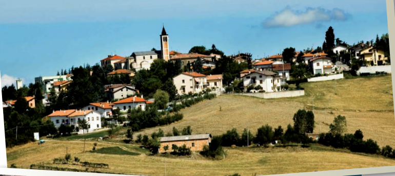
Montecalvo in Foglia