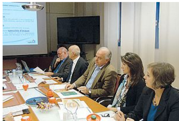
Un'immagine della presentazione dell'iniziativa