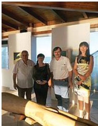
L'INAUGURAZIONE Autorità con 'l'immersinista'